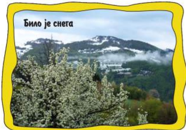
Било је снега