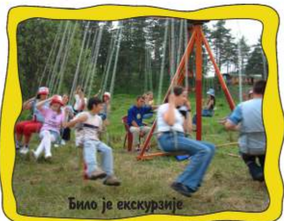
Било је екскурзије