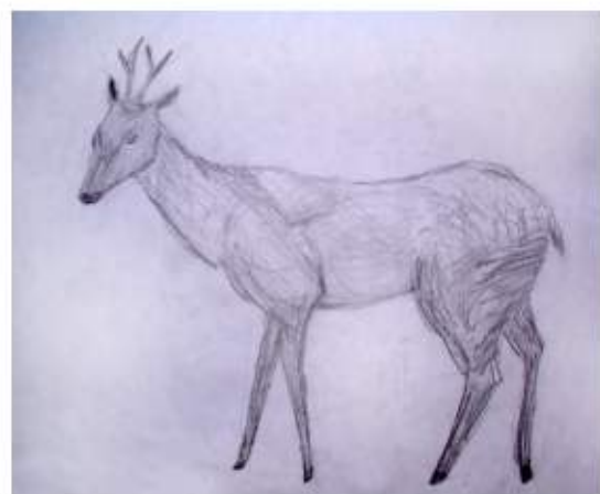
Радован Стаменић, VII разред