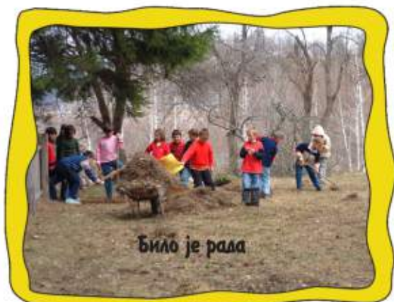
Било је рада