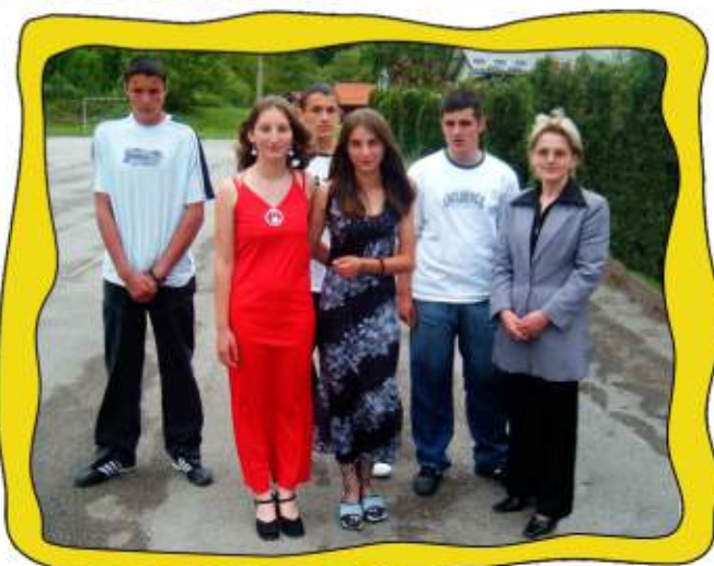
А они ипак одоше !