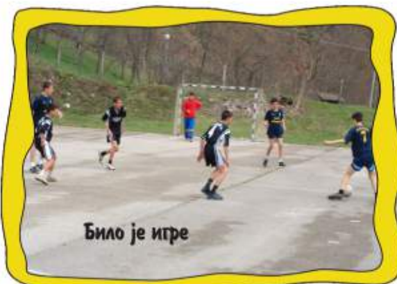
Било је игре