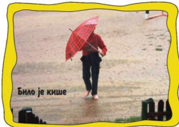
Било је кише