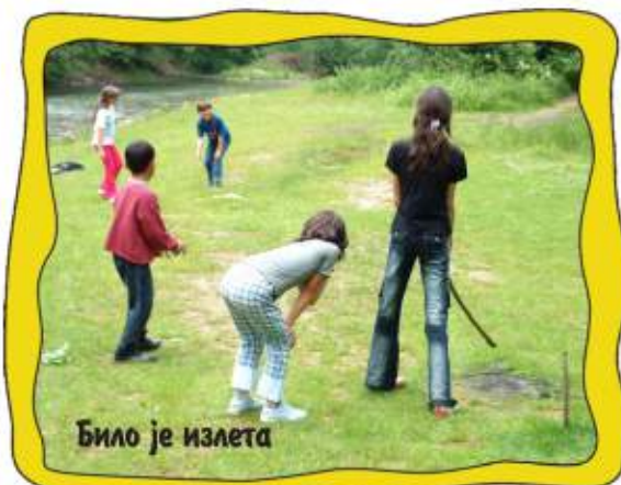
Било је излета